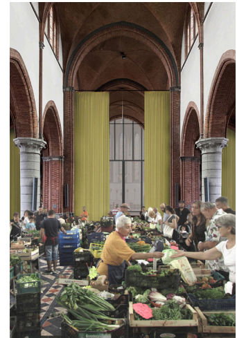
afbeelding scenario uit haalbaarheidsonderzoek Sint-Jozefskerk, Menen

tijdelijke, functionele noden te overstijgen en alle ingrepen in te bedden in een langetermijnplan voor her- of nevenbestemming, worden zo weinig mogelijk toekomstige mogelijkheden uitgesloten. Het opstellen en/of actualiseren van de huidige kerkenbeleidsplannen is daarom waardevol en nodig.