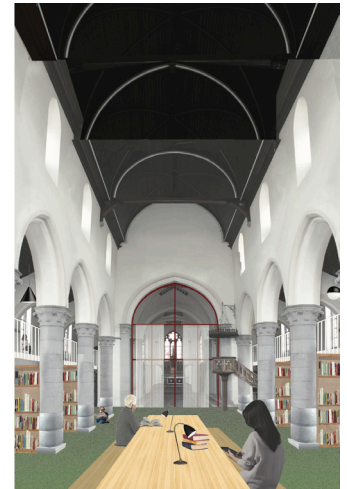
afbeelding scenario uit haalbaarheidsonderzoek Sint-Christoffelkerk, Scheldewindeke

Soms kunnen kleine ruimtelijke ingrepen de mogelijkheden van het gebouw vergroten en verbreden. Dat is natuurlijk een droomscenario.