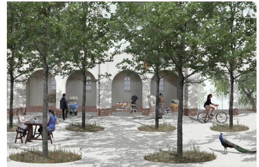
afbeelding scenario uit haalbaarheidsonderzoek Sint-Willibrorduskerk, Heusden-Zolder

Wanneer een gemeenschap mentaal al afstand heeft genomen van een kerkgebouw, moet het bespreekbaar zijn om afscheid te nemen van de kerk.